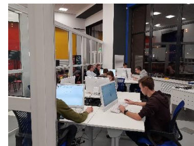
решение практических задач